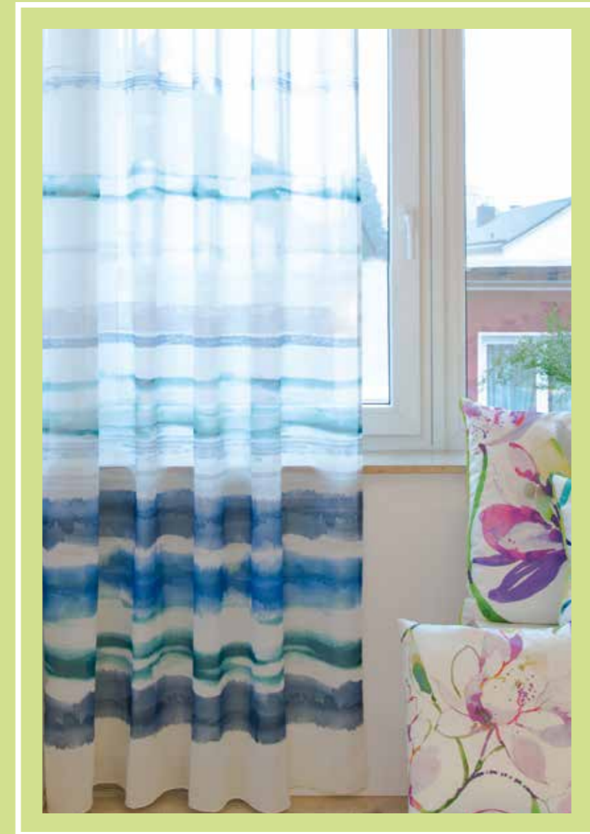
Inbetween: Shine 4437-10 Lagoon

Deko / decoration fabric: Smile 4434-13 Orange