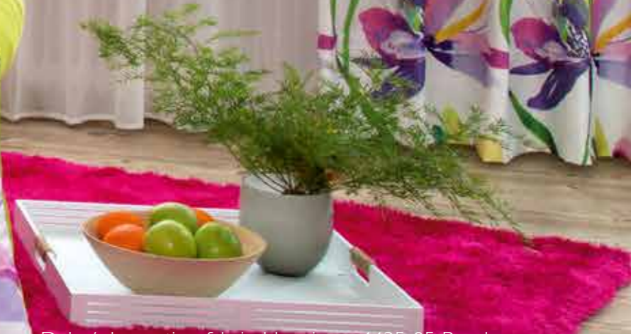
Deko/ decoration fabric: Happiness 4435-05 Purple Inbetween (180° gedreht verarbeitet): Sprinkle 4436-04 Orange In this picture the design „Sprinkle“ has been turned upside down