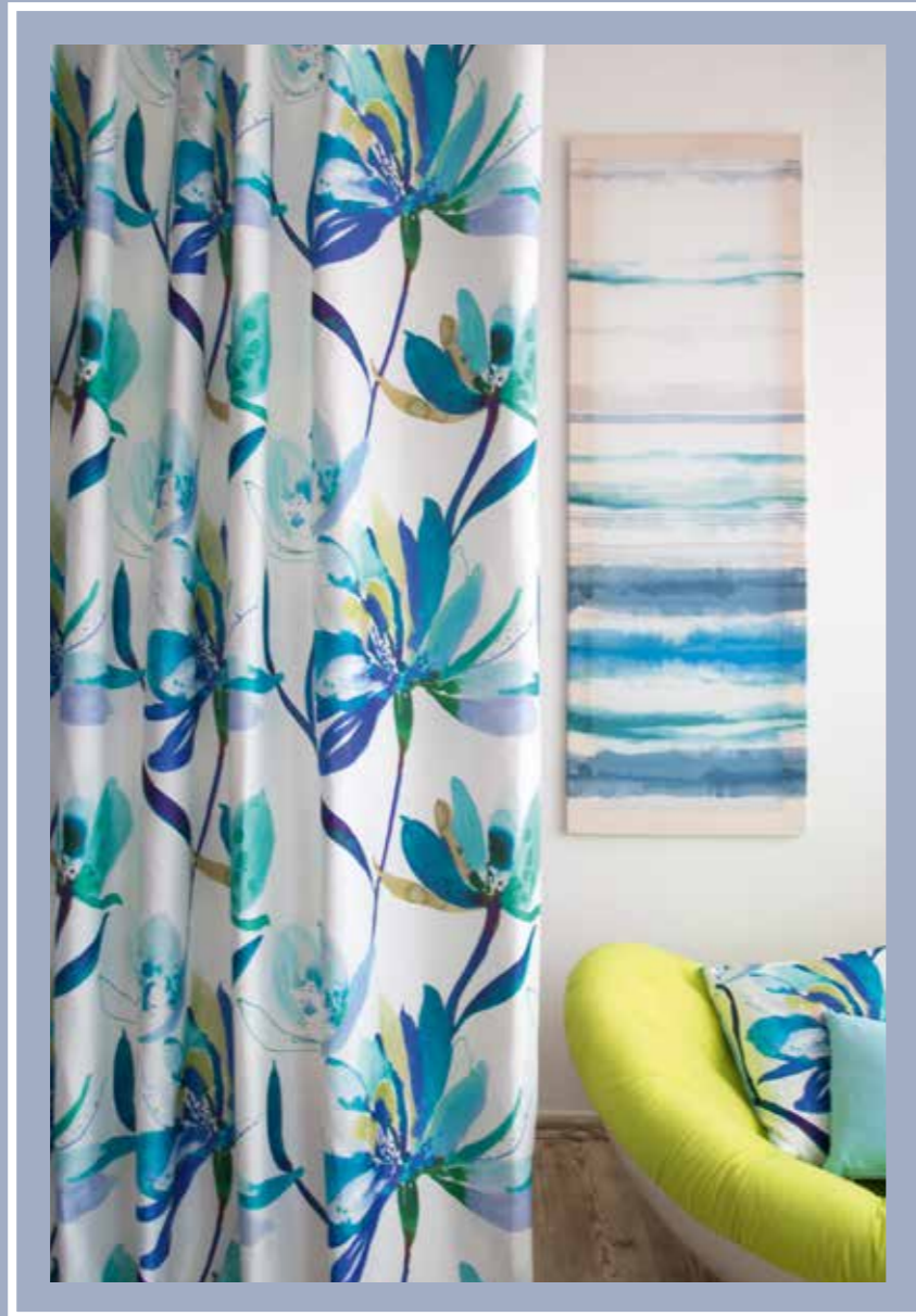
Deko/ decoration fabric: Happiness 4435-29 Lagoon