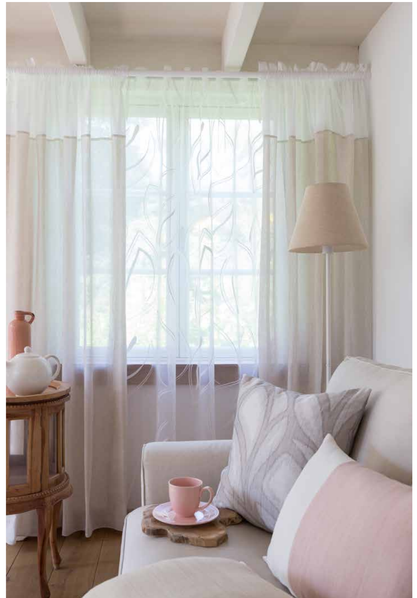
Inbetween: Lars 4351-66 Biscuit, Lars 4351-04 White Ausbrenner/ burn-out: Alva Devoré 4387-16 White Kissen/ cushions: Nora 4357-08 Stone Luka 4384-40 Rose, 4384-02 White