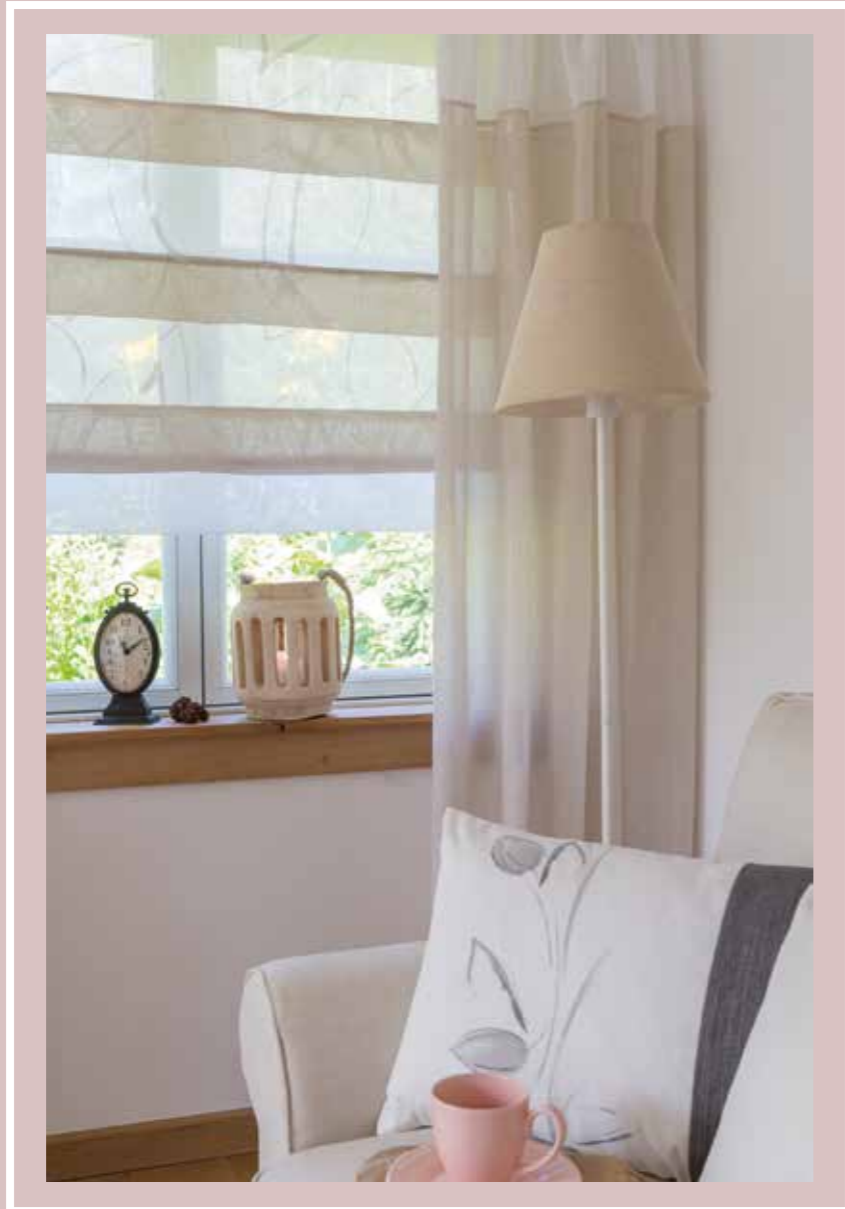
Raffrollo/ roman blind: Alva 4386-17 Natural Inbetween: Lars 4351-66 Biscuit, Lars 4351-04 White Kissen/ cushion: Blossom 4362-17 Stone