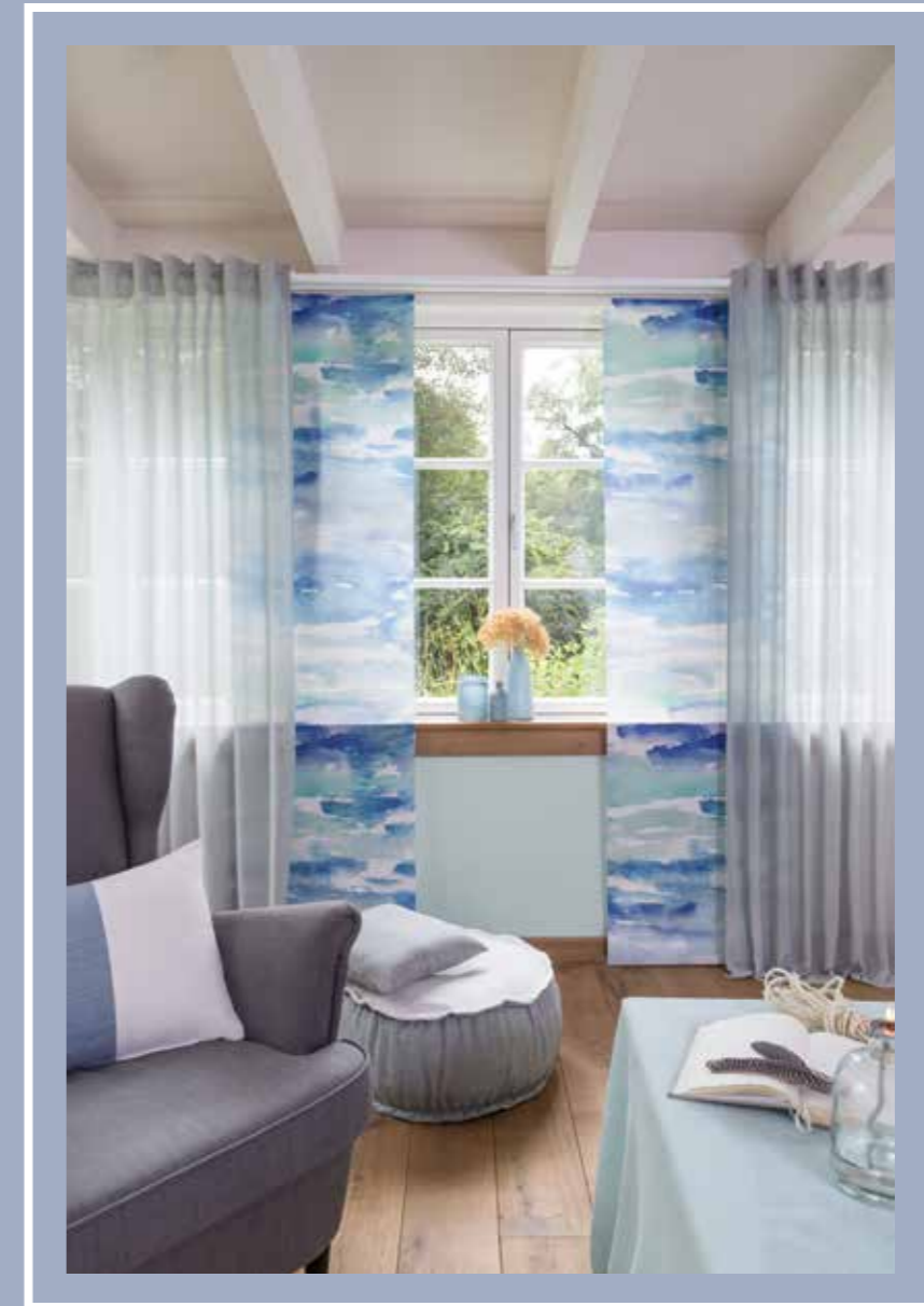
Inbetween: Lars 4352-10 Jade Flächenvorhang/ panel curtain: Panelo Festival 4366-06 Lagoon