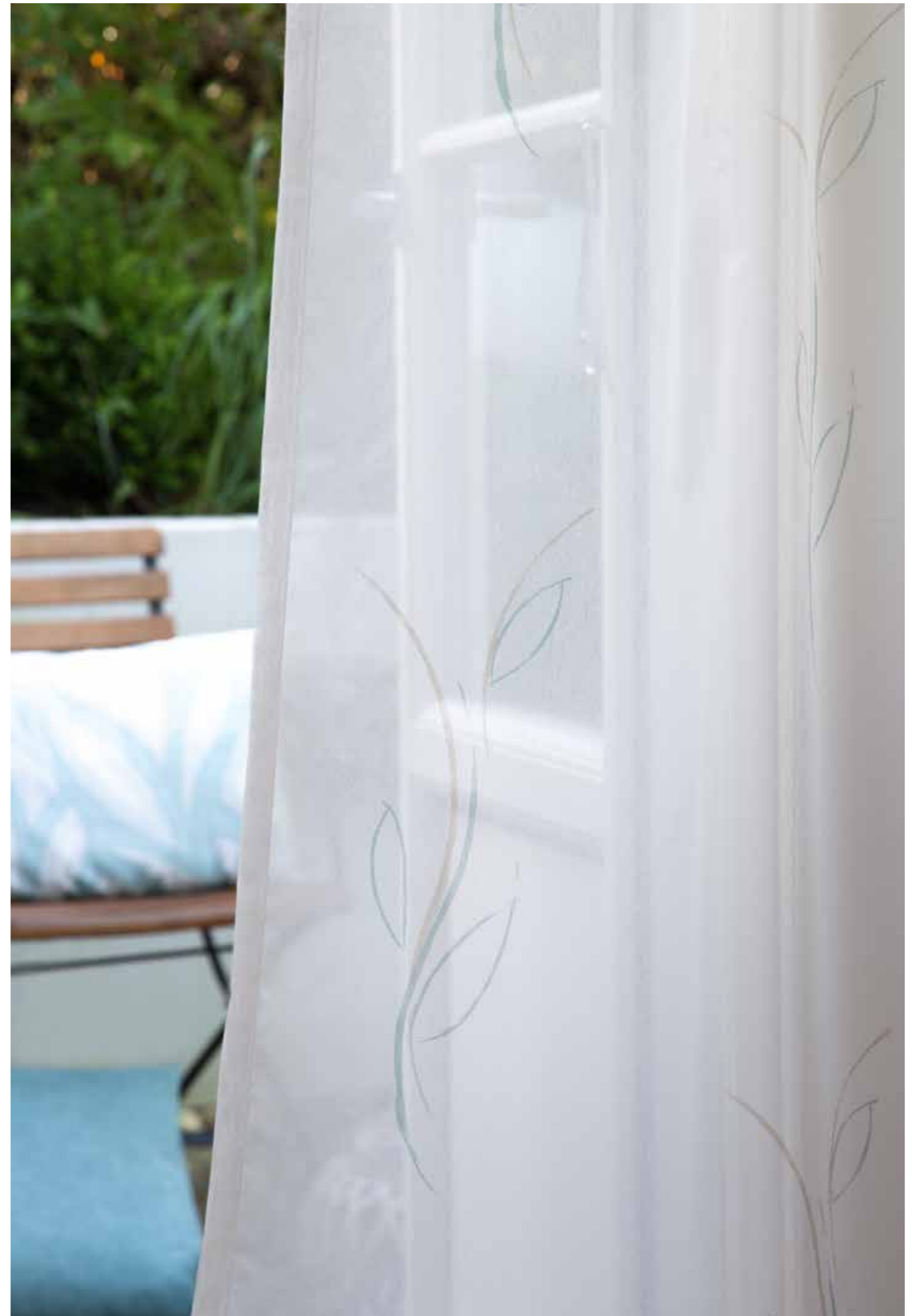
Store: Jasmin 4360-02 Jade