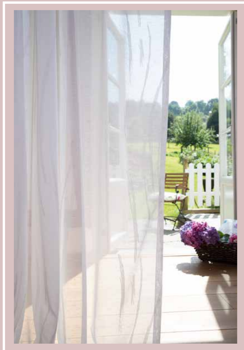
Scherli: Milla 4380-13 White

Deko/ decoration fabric: Blossom 4362-31 Spring Raffrollo/ roman blind: Tilda 4381-05 Spring mit/ with Lars 4351-80 Lemon, Lars 4351-97 Apple Inbetween: Lars 4351-66 Biscuit, Lars 4351-04 White