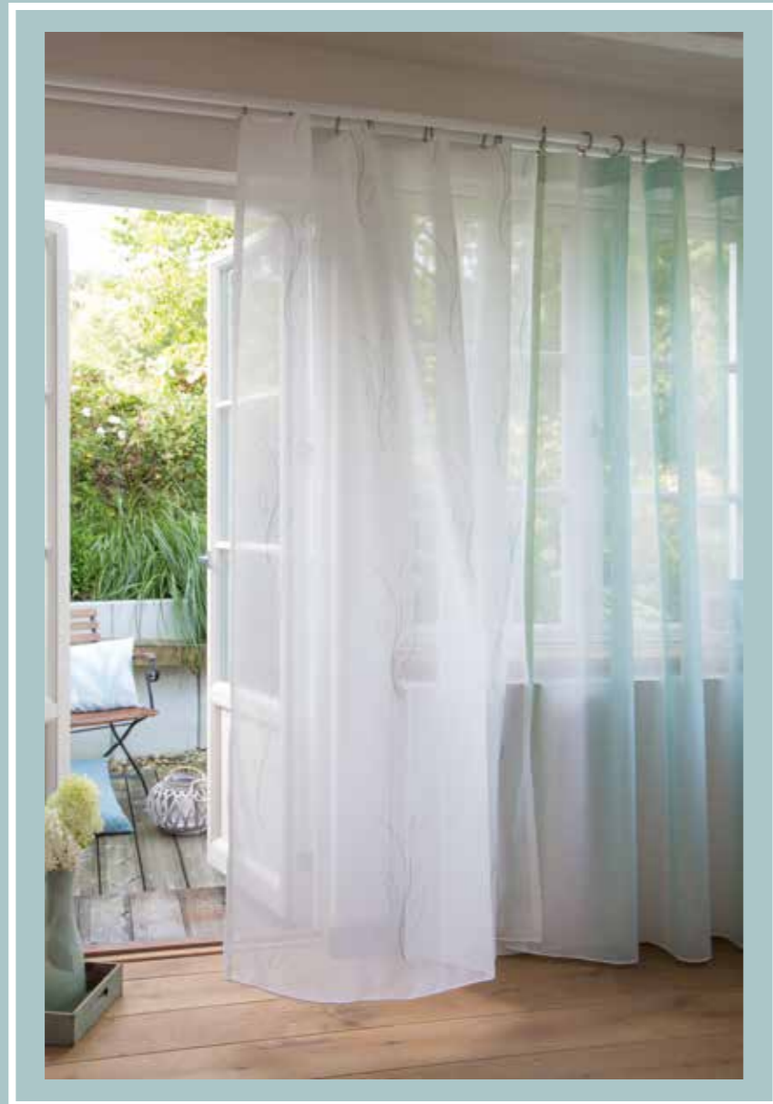
Store: Jasmin 4360-02 Jade Inbetween: Vera 4389-07 Jade